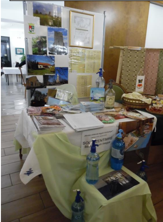
Értékeink-konferencia - Lakitelek