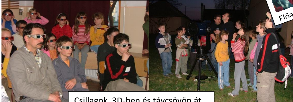
Csillagok 3D-ben és távcsövön át